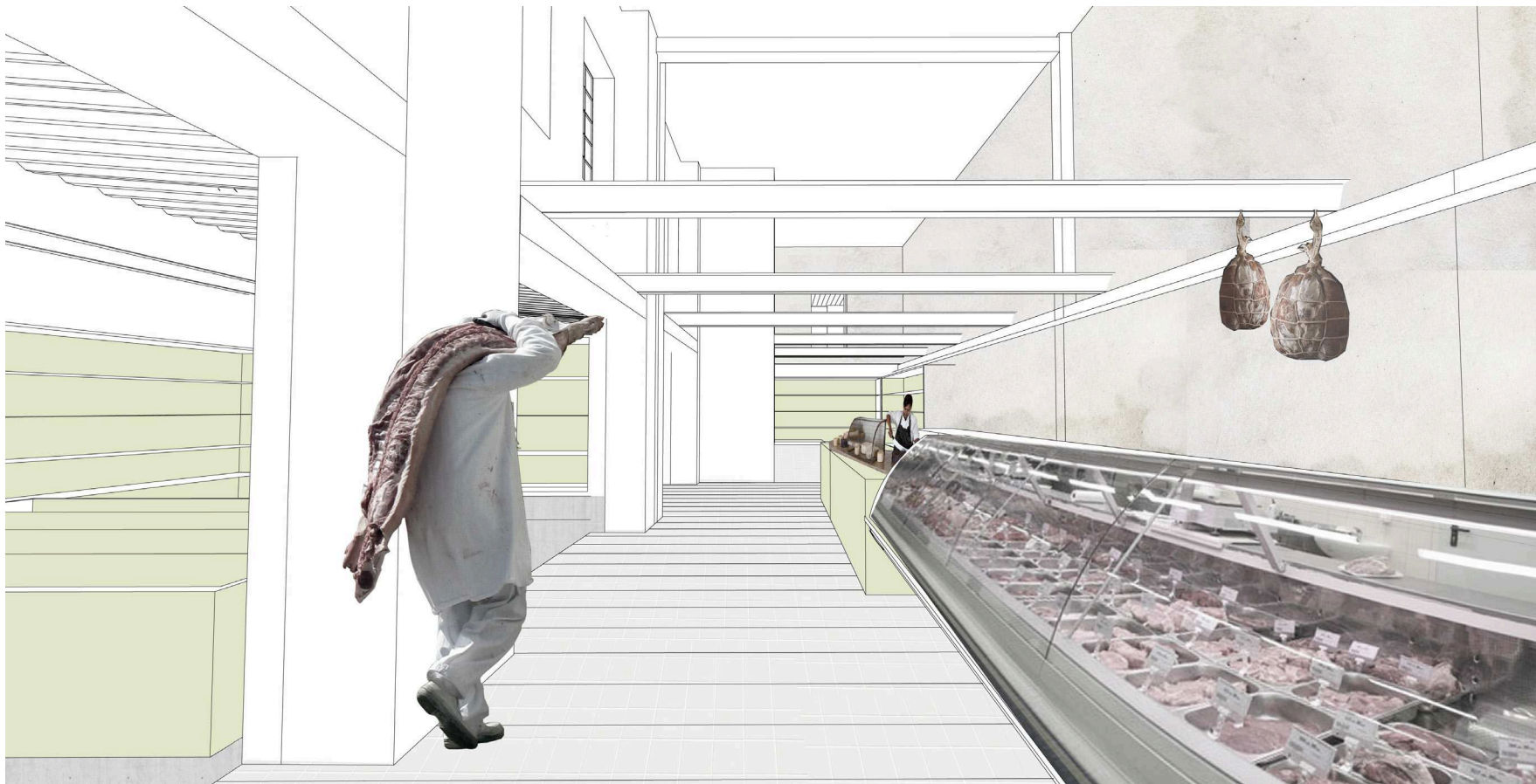
Pohľad z oddelenie mäsa a syrou do predajne. Striedanie výšky v interiéri predajne, svetlo z okien na druhom poschodí pôvodného objektu, nová stropná konštrukcia z trapézového plechu.